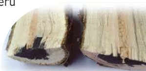
Test prostupnosti inkoustem před ošetřením a po ošetření BlocCade

Pomocný prostředek ve formě suspenzního koncentrátu polymerů určený k ošetření ran po řezu. BlocCade vytváří na řezných ranách nepropustnou mechanickou bariéru a tím zabraňuje prostupu patogenu pleťtivy do dřeva. Je spolehlivou metodou ochrany před chorobami kmínku u révy vinné (ESCA a eutypové odumírání) a prevencí chorob při mechanickém poškození a řezu ovocných stromů.